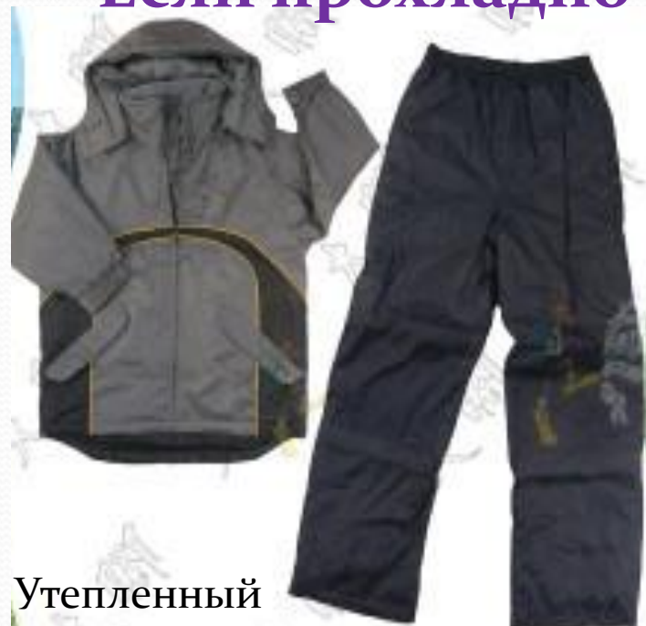
Утепленный ветрозащитный костюм