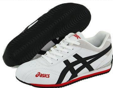
Кроссовки или спортивные тапочки