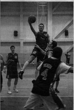
В ИГРЕ ФИНАЛИСТЫ: литовская команда атакует (слева), баскетболисты Лиги журналистов защищаются