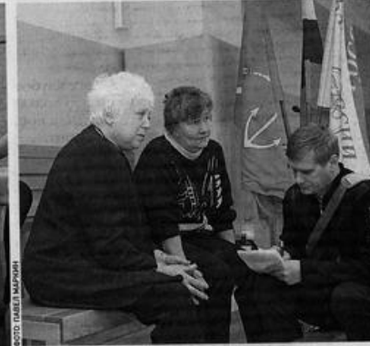
Матери всегда живут надеждой