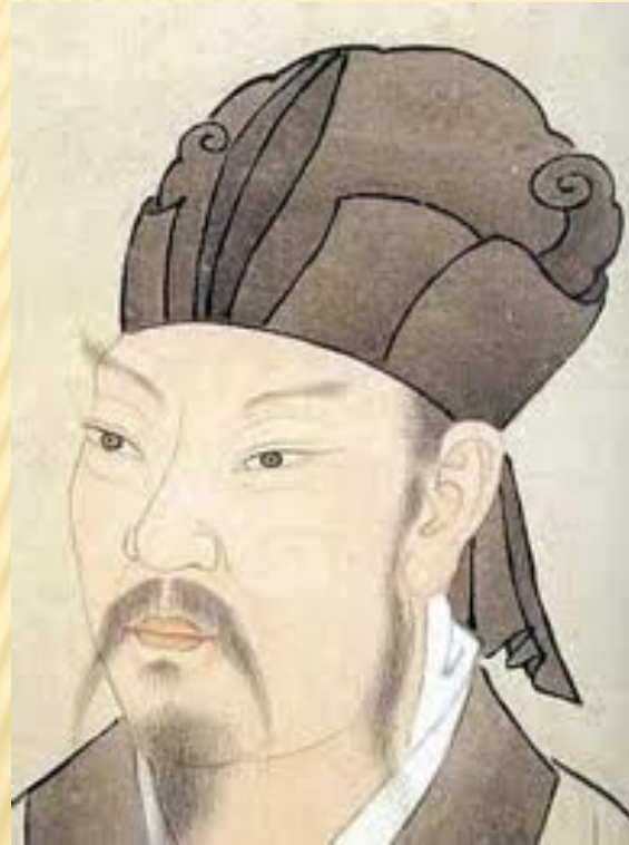
Хань Юй. 韩愈 (768—824)

Конфуцианство как этико-политическая и религиозная система проникло во все поры общественной жизни и в течение многих веков определяло нормы морали, семейные и общественные традиции, научную и философскую мысль, препятствуя их дальнейшему развитию и выработав определённые стереотипы в сознании народа, в особенности среди интеллигенции. Конфуцианство ещё больше укрепилось после острой борьбы с буддизмом в 7-8 вв. Большая роль в этом принадлежала известному писателю и мыслителю Хань Юю (768-824), выступившему с резкой критикой буддизма и в защиту конфуцианства.