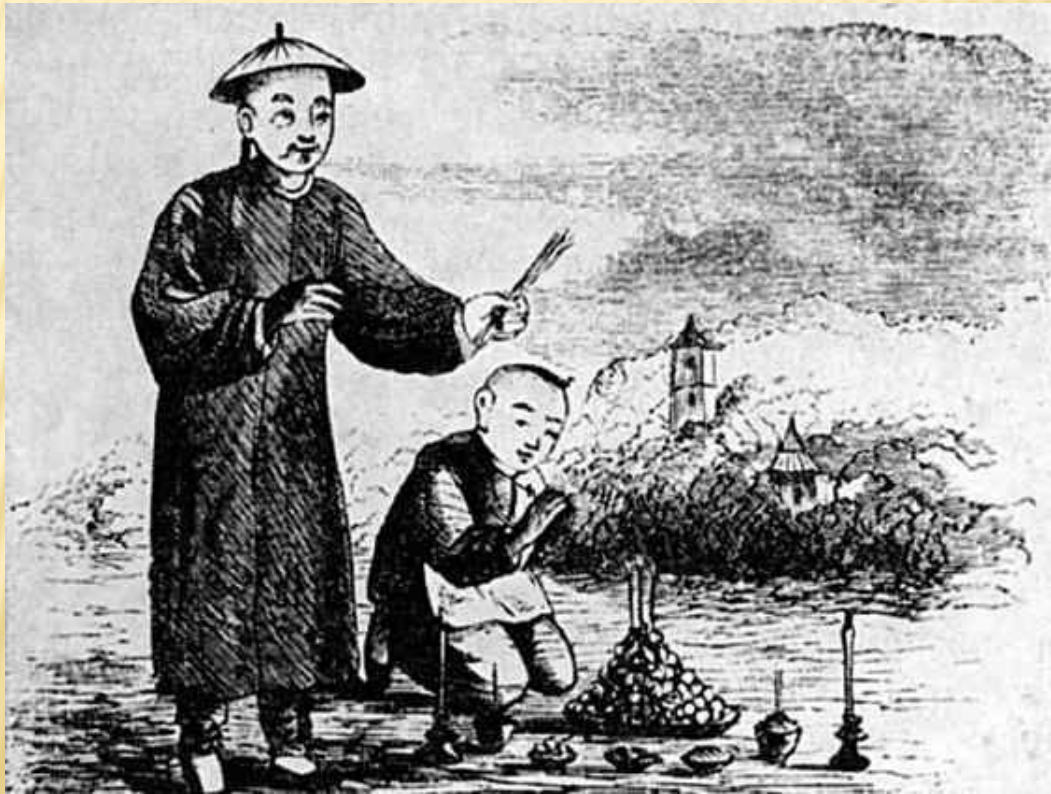
Молодой Конфуций приносит жертву

Исходным пунктом учения Конфуция является достижение гармонии между нравственным совершенствованием человека и его деятельностью. Такая гармония, по его мнению, - залог построения идеального общества и государства. Социальным идеалом послужил золотой век в истории Китая, правление мифических императоров Яо, Шунь и Юй. За прошедшее время общество Китая деградировало, что выразилось в многочисленных конфликтах. Исходя из этого конфуцианство предлагает принцип «выпрямления имен» (возвращение прежнего смысла словам и понятиям), который будет предпосылкой восстановления прежних норм.