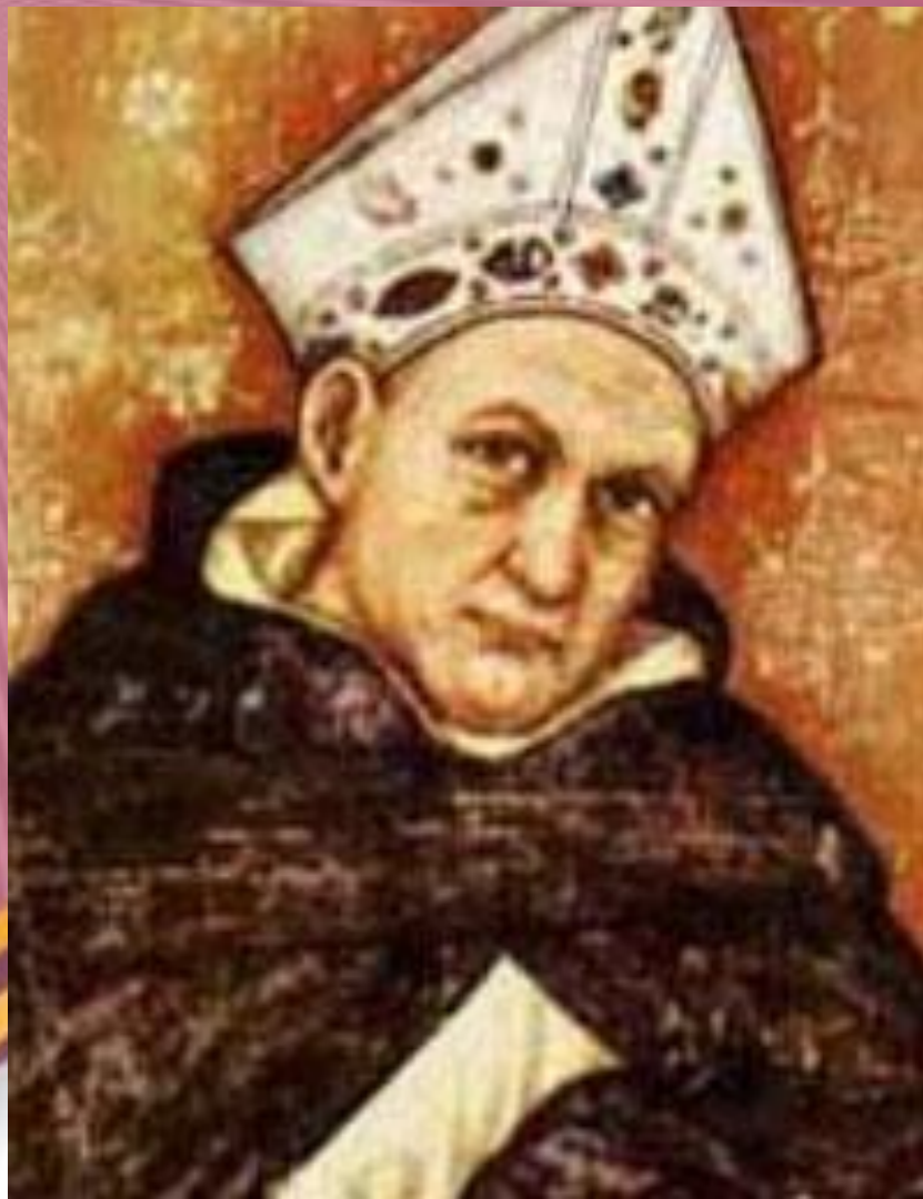
Альберт Великий (1206-1280)