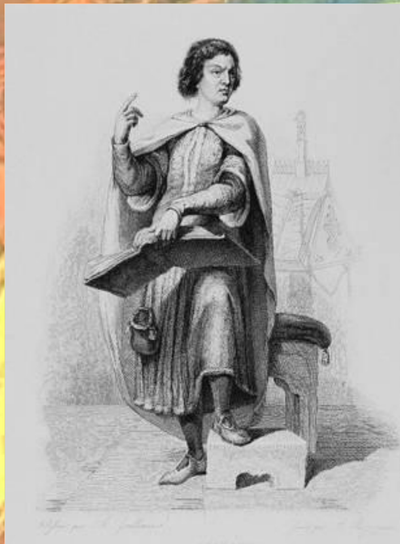
Петр Абеляр (1079-1142)