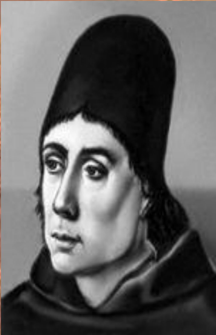
Дунс Скот (1256-1308)