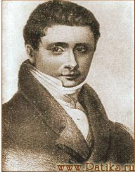
Н. И. Тургенев. Гравюра с рисунка Н. Мартоса. 1811 г.