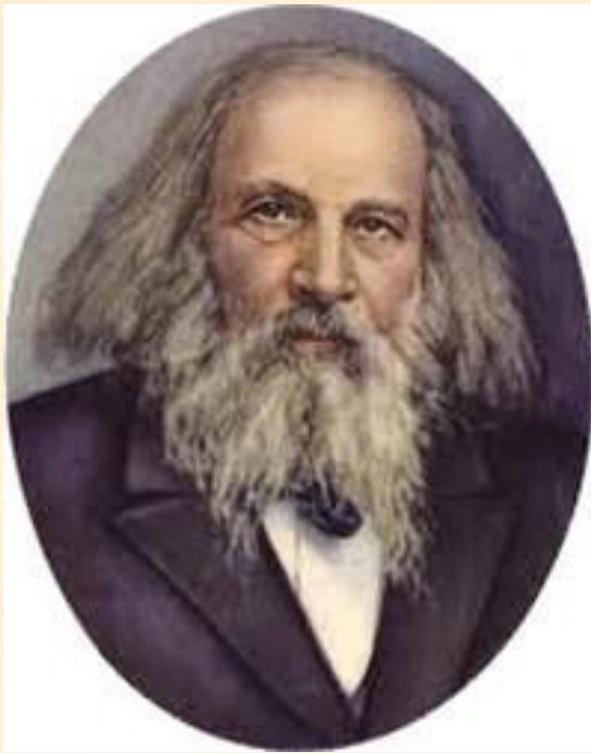
Дмитрий Иванович Менделеев (1834-1907 гг.)

«Масса вещества есть именно такое свойство его, от которого должны находиться в зависимости все остальные свойства. Поэтому ближе и естественнее всего искать зависимость между свойствами и сходствами элементов, с одной стороны, и атомными весами их, с другой стороны»