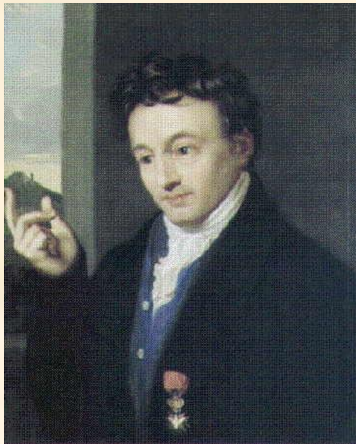
Иоганн Вольфганг Дёберейнер (1780-1849 гг.)

В 1829 году Деберейнер опубликовал найденный им «закон триад»: атомный вес многих элементов близок к среднему арифметическому двух других элементов, близких к исходному по химическим свойствам (стронций, кальций и барий; хлор, бром и йод и др.).