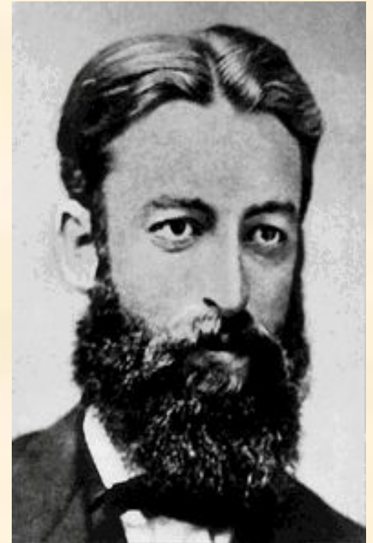
Юлиус Лотар Мейер (1830-1895 гг)

В этом же десятилетии появились ещё несколько попыток систематизации химических элементов; ближе всего к окончательному варианту подошёл Мейер (1864). Он расположил химические элементы в порядке возрастания их атомных масс.