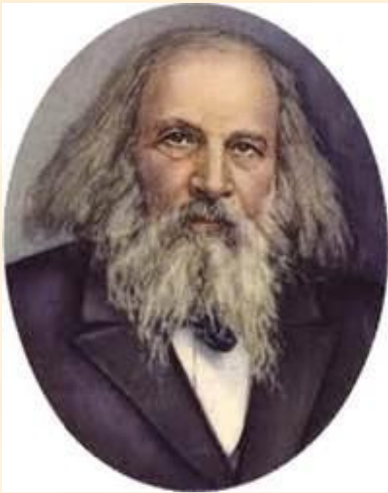
Дмитрий Иванович Менделеев (1834-1907 гг.)

«Масса вещества есть именно такое свойство его, от которого должны находиться в зависимости все остальные свойства. Поэтому ближе и естественнее всего искать зависимость между свойствами и сходствами элементов, с одной стороны, и атомными весами их, с другой стороны»