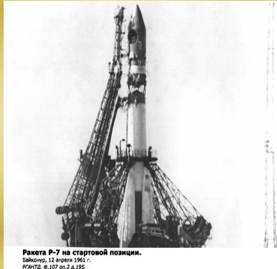
Ракета Р-7 на стартовой позиции. Байконур, 12 апреля 1961 г. РГАНТД. Ф. 107 оп. 2 д. 195.