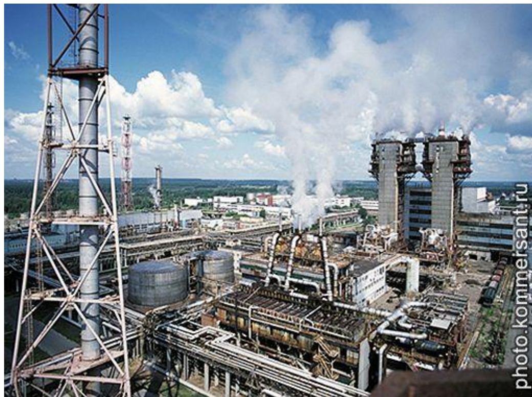
Кирово-Чепецкий химический комбинат