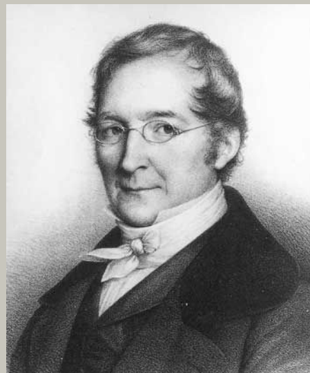
Жозеф Луи Гей