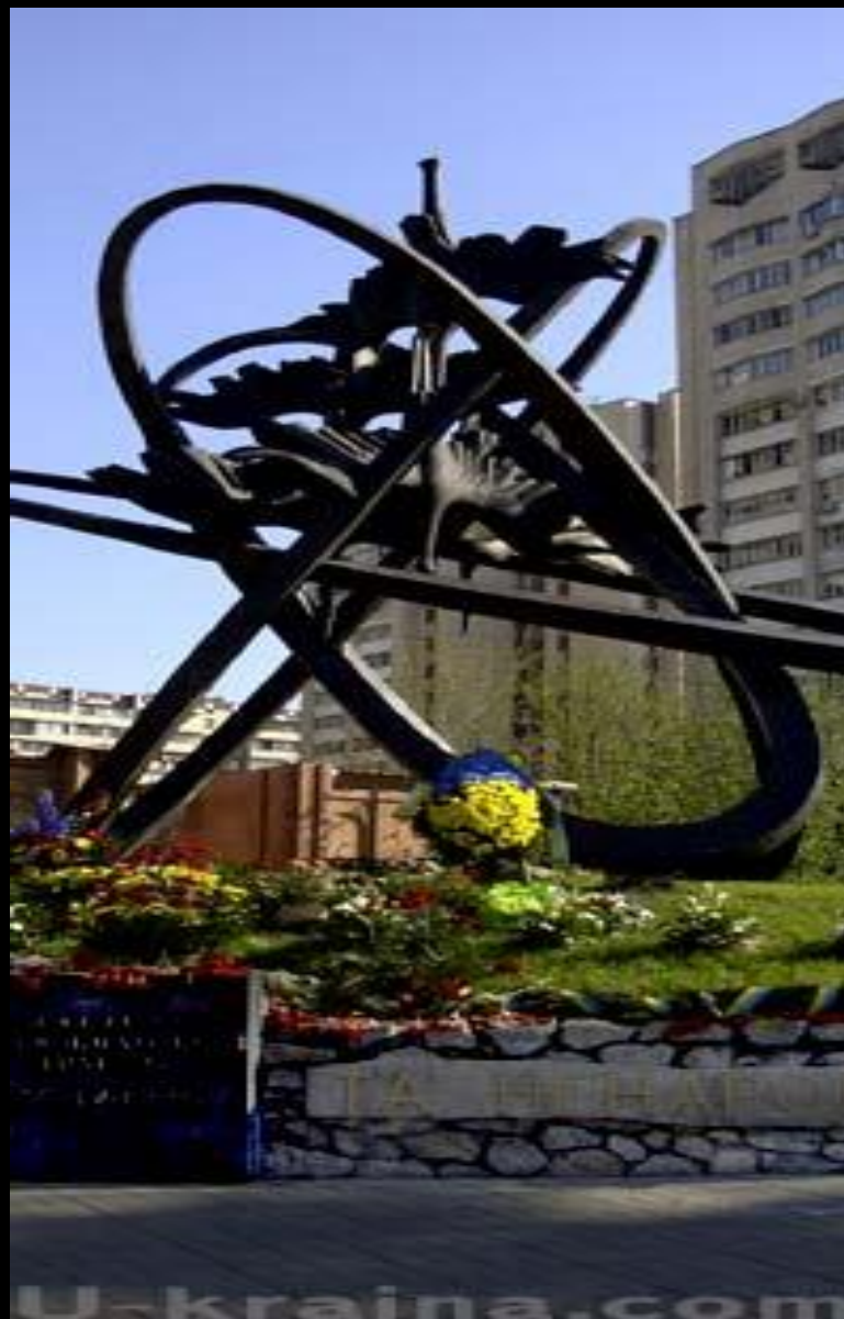
Монумент на ул. Чернобыльской (Киев)