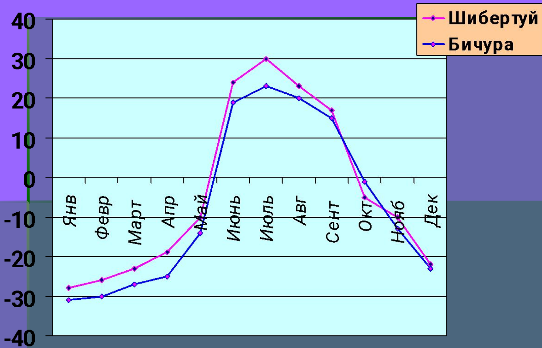
Диаграмма средней температуры воздуха Синяя полоса- температура с.Бичуры и розовая-с.Шибертуй. В Шибертуйе было теплее.