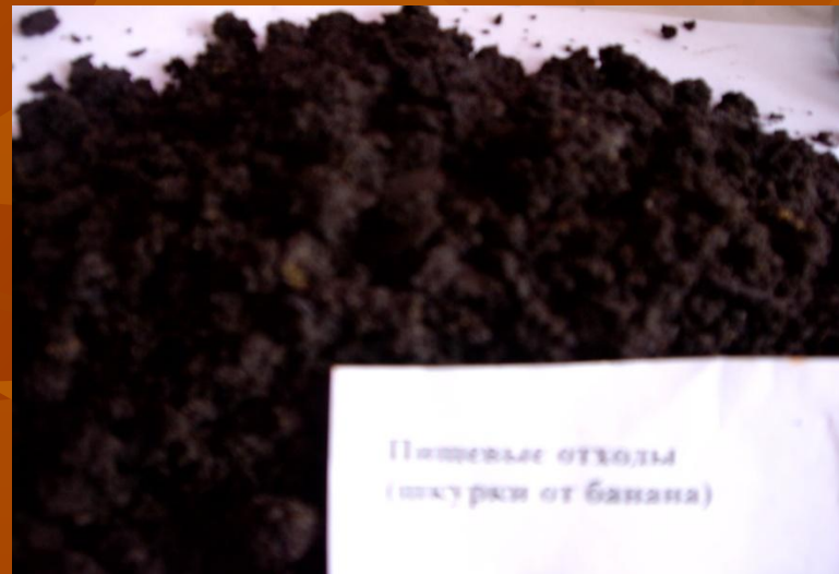
Пищевые отходы (шкурки от банана)