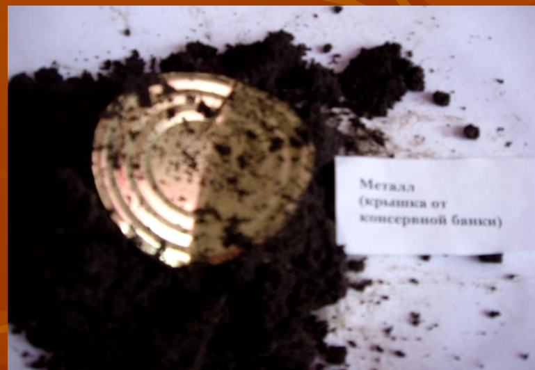
Металл (крышка от консервной банки)