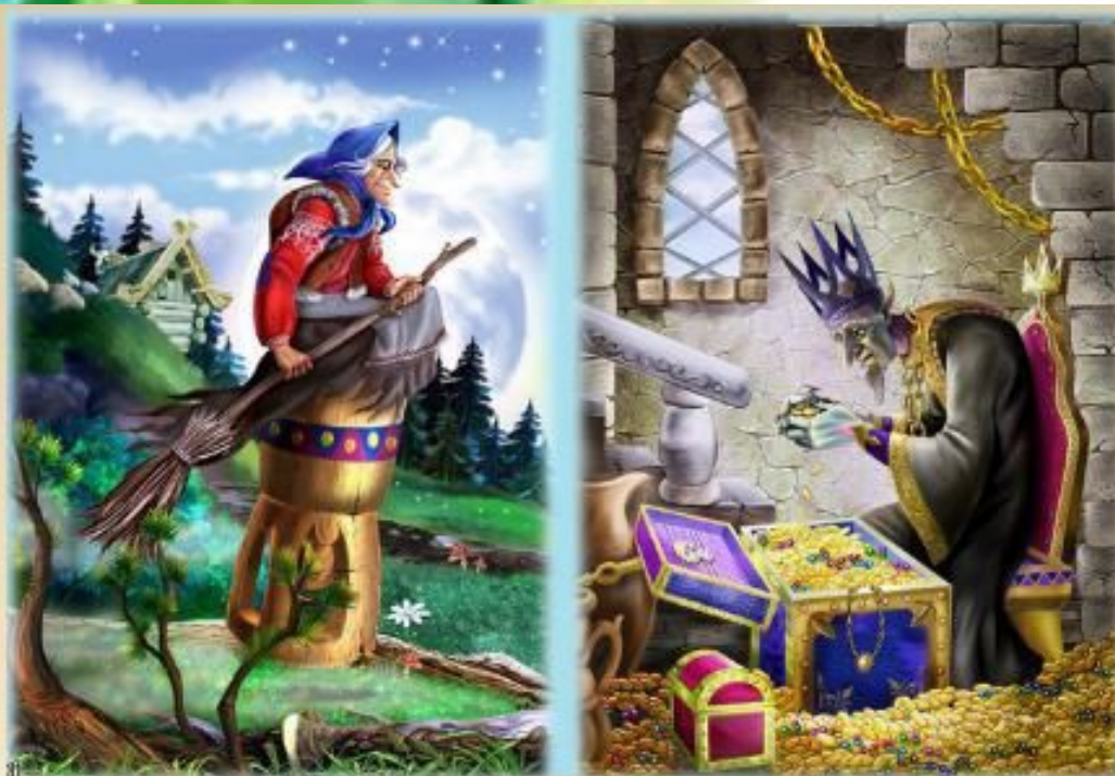
Сказка «Кощей Бессмертный»