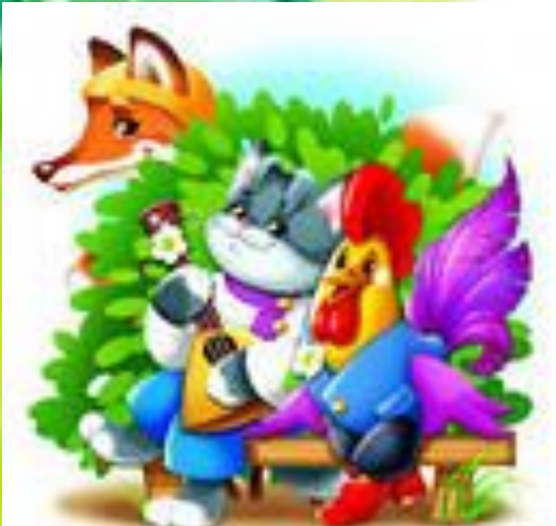
Сказка «Кот и Лиса»

С давних времен люди заводили домашних животных. Люди всегда осуждали тех, кто не следил за своими животными и выгонял надоевших из дома. Такие животные не могли выжить в диких условиях.