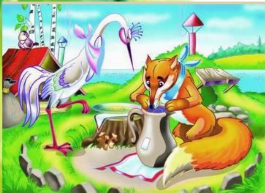
Сказка «Лиса и журавль»