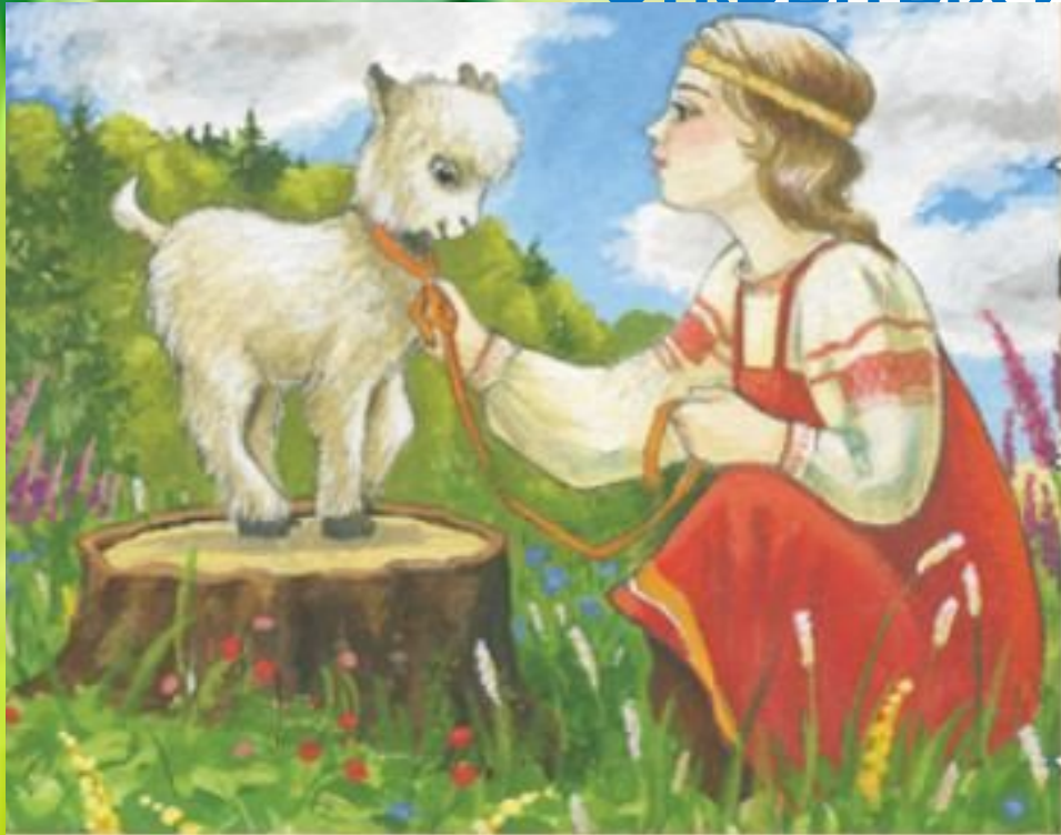
Сказка «Сестрица Алёнушка и братец Иванушка»

С давних времен люди считали, что многие серьезные болезни людям передаются от животных. Один из путей передачи инфекции - через воду. Поэтому даже в сказках предостерегали не пить грязную воду из открытых источников.