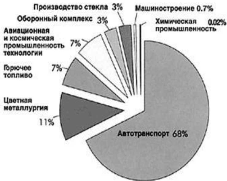
Источники поступления свинца в атмосферный воздух.