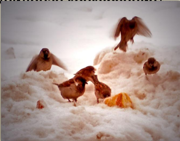
Внутривидовая конкуренция за пищу

Обе формы конкуренции возможны как между особями одного и того же вида как ( внутривидовая конкуренция ), так и между особями разных видов ( межвидовая конкуренция )