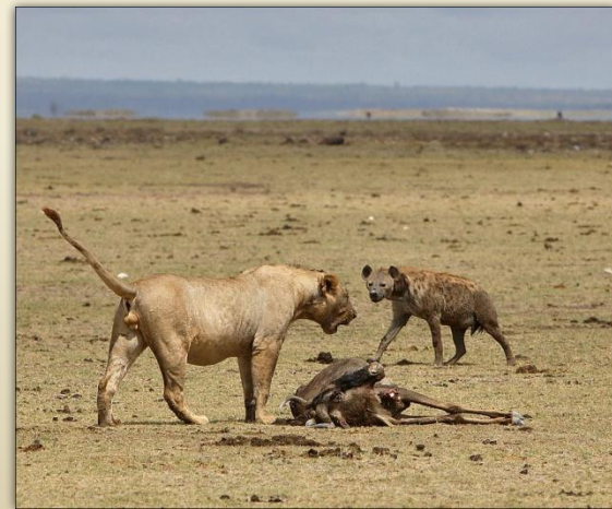
Межвидовая конкуренция за пищу