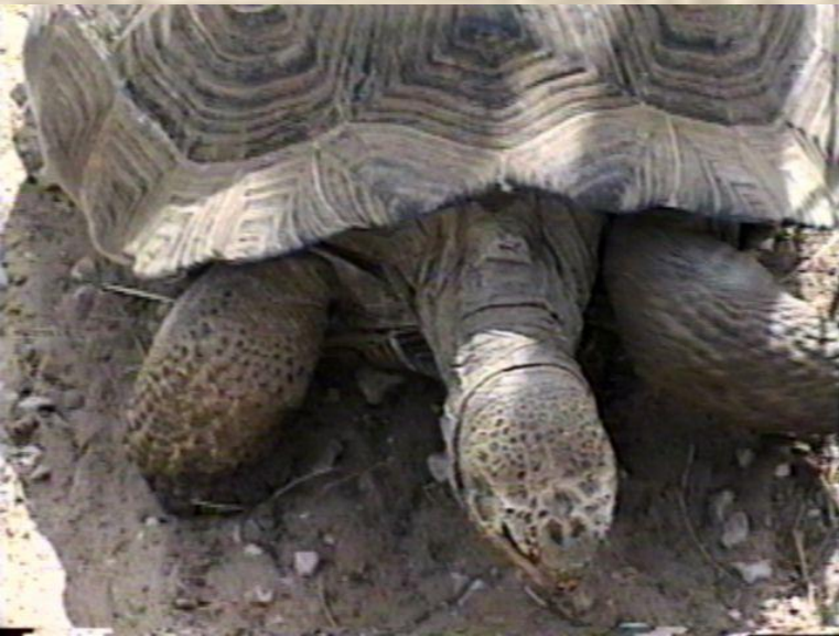
Галапагосская гигантская черепаха

Зубр – вымирающее животное! Зубровый питомник на базе Приокско-Тerrasного заповедника под Москвой.