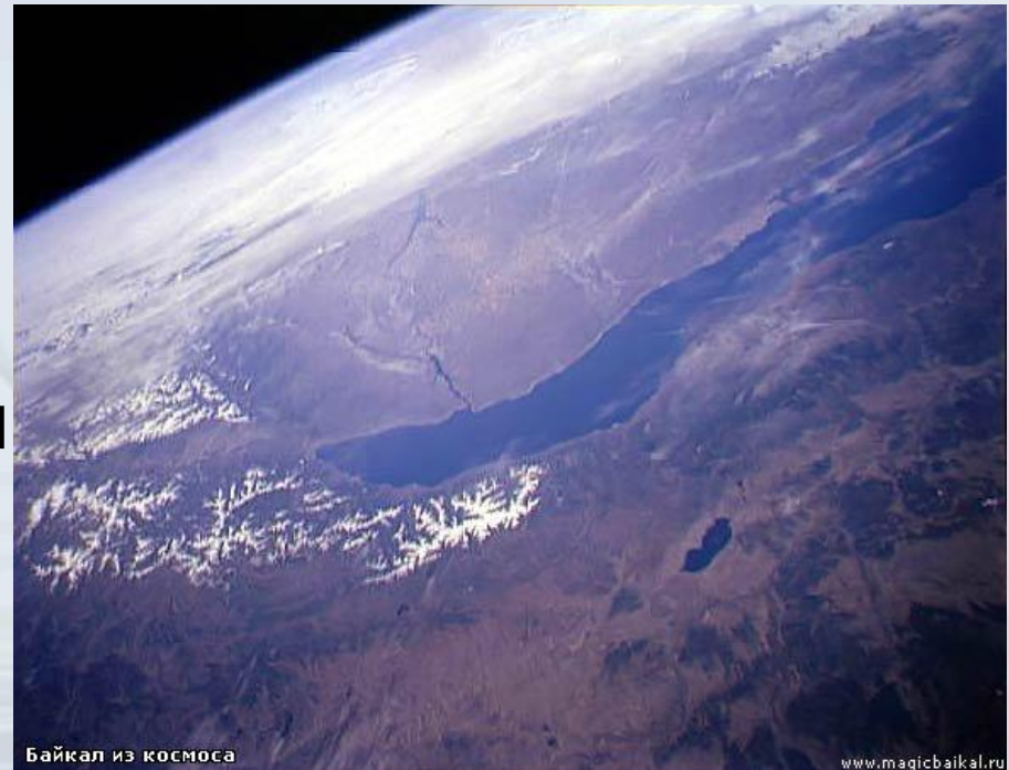
Байкал из космоса