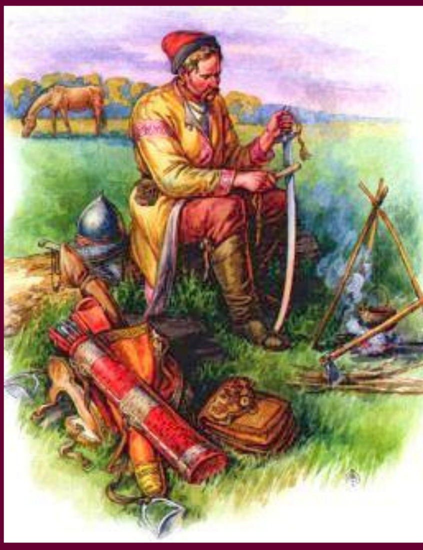
Казак на отдыхе.