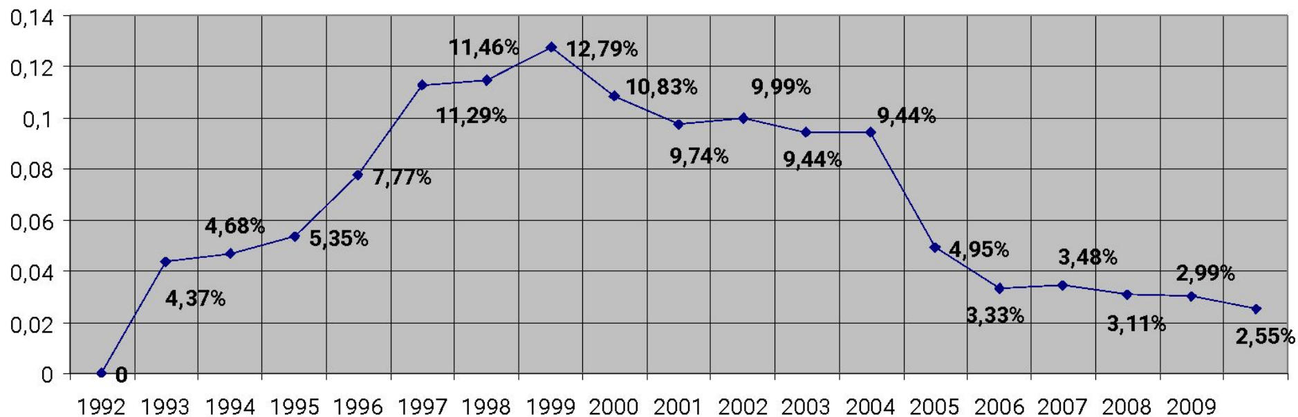
Динамика акциза 1992-2009г.г. (в % к налоговым поступлениям)