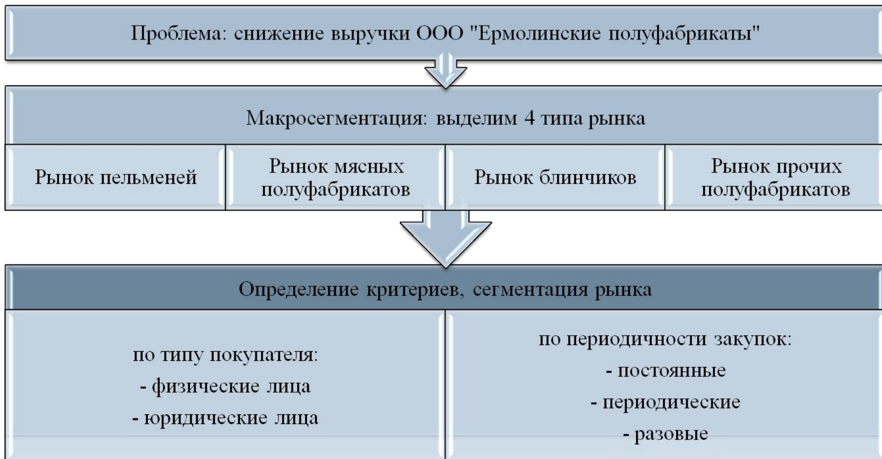
Рисунок 3 – Сегментация покупателей ООО «Ермолинские полуфабрикаты»