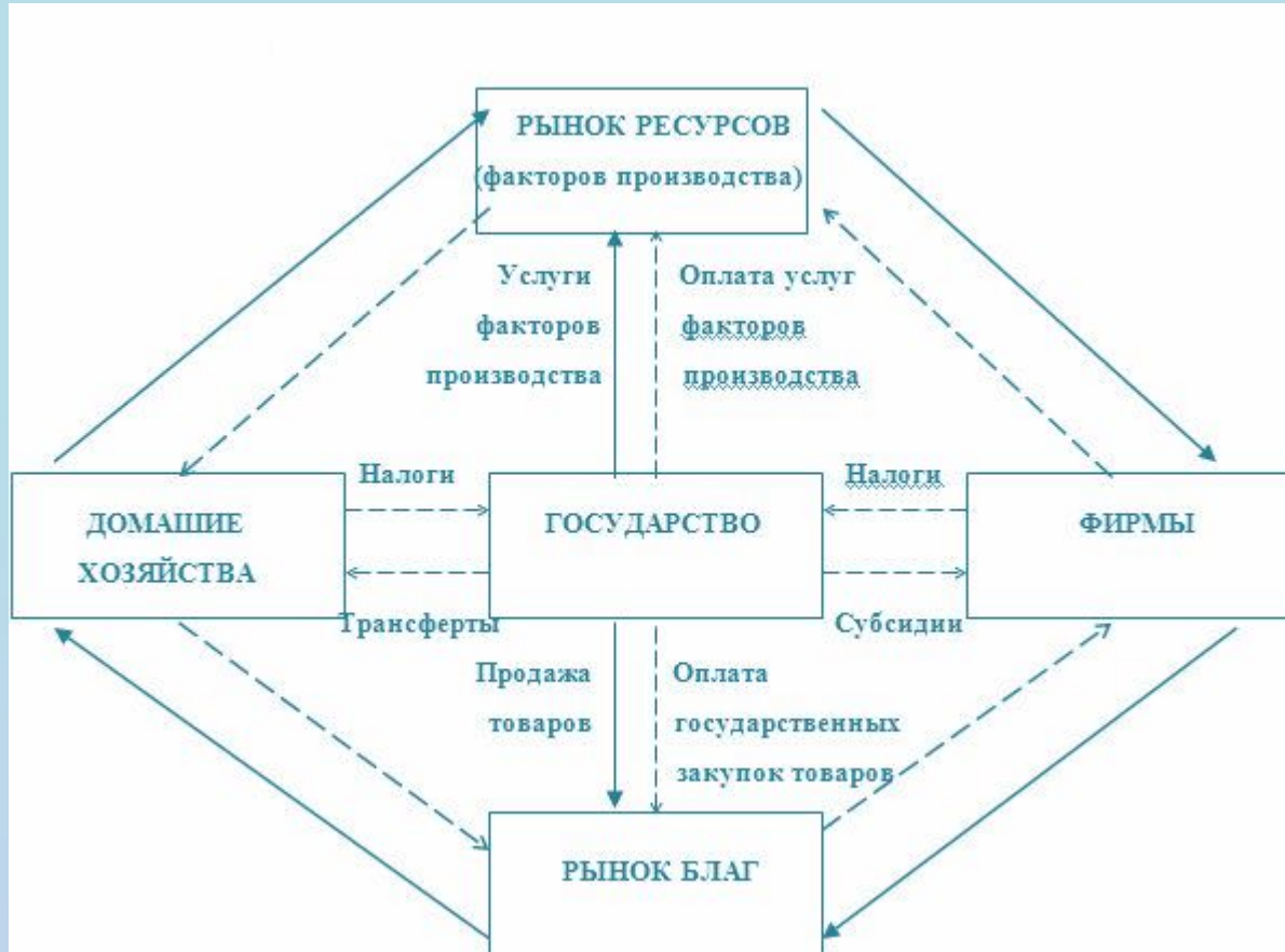
Схема кругооборота национальной экономики