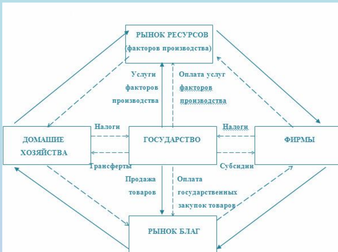
Схема кругооборота национальной экономики