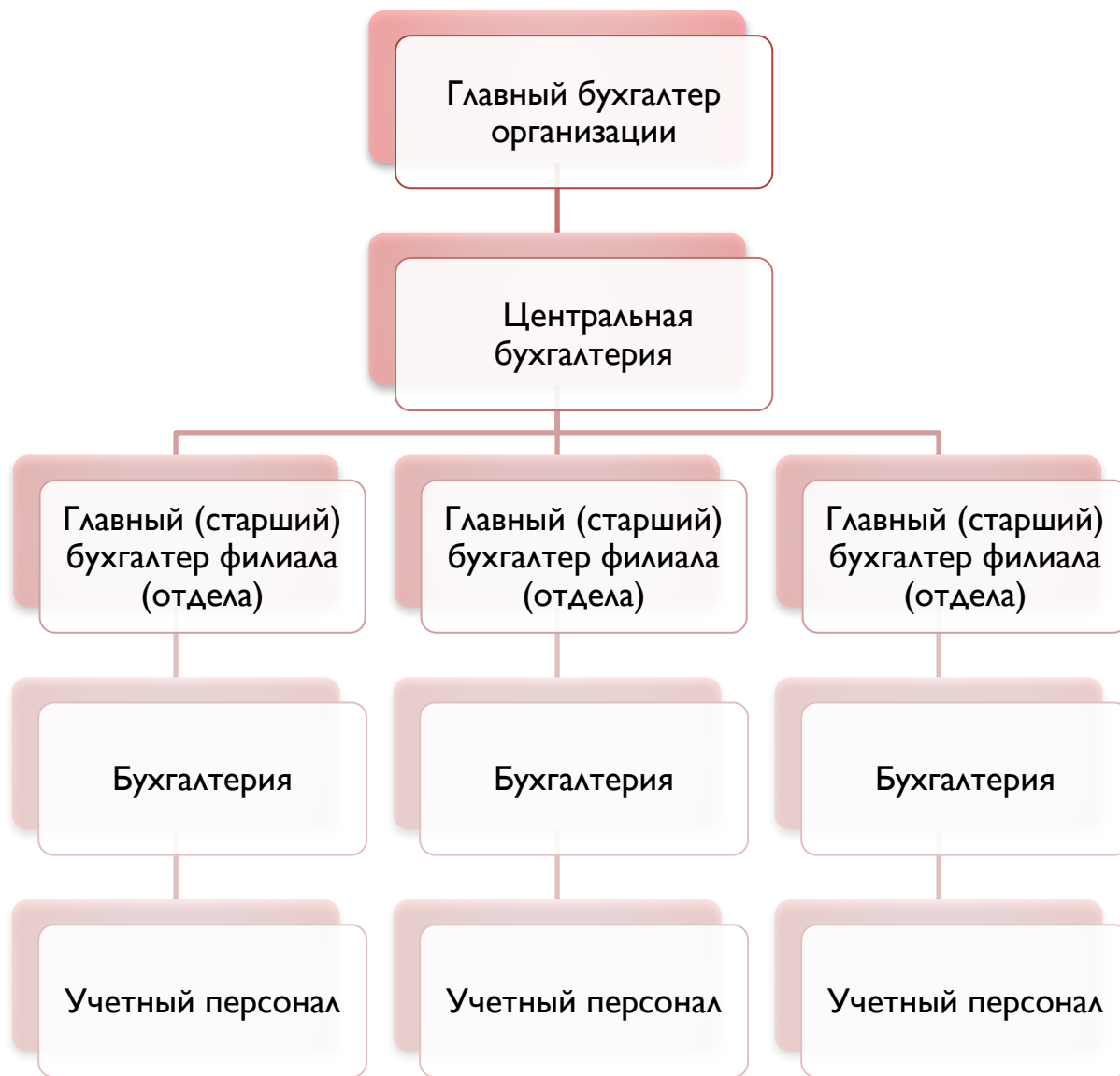
Схема децентрализованной организации учета