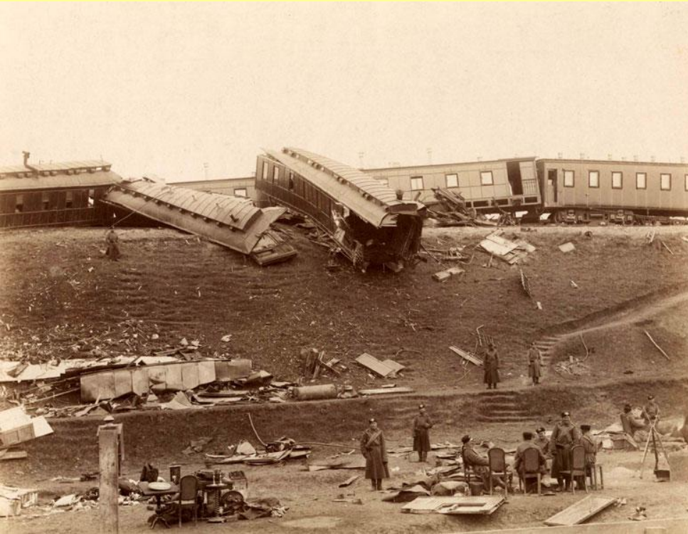
Катастрофа императорского поезда близ ст. Борки Курско-Харьковско- Азовской железной дороги. 17 октября 1888 г.

В 1888 г. императорский поезд потерпел катастрофу близ станции Борки. Крушение было следствием чрезмерно высокой скорости тяжелого царского поезда, которого легкие рельсы и деревянные шпалы не выдержали.