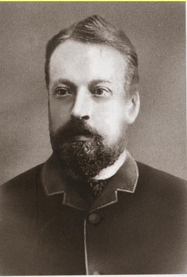
Сергей Юльевич Витте (1849–1915)

В 1892 г. вместо заболевшего Вышнеградского министром финансов стал С.Ю. Витте .