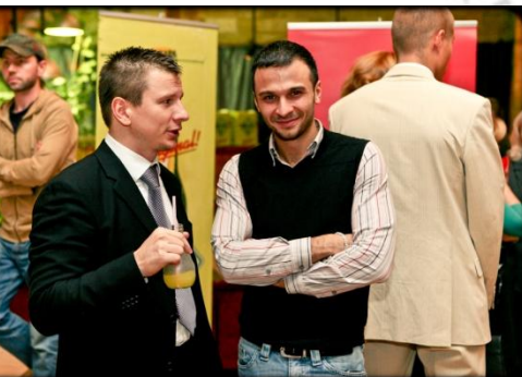
Александр Берник (телеведущий)