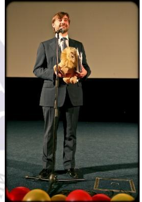
Почетный гость Презентации 2009 г Железняк С.В. (депутат Государственной Думы)