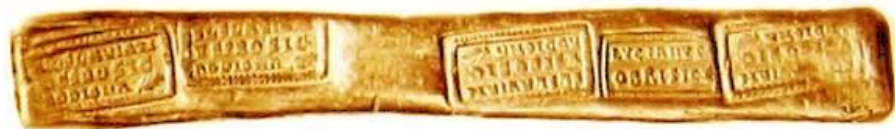
Заготовка для монет.