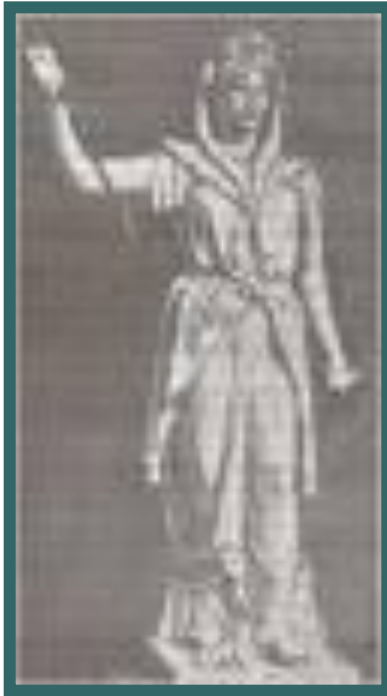
Статуя Юноны Монеты