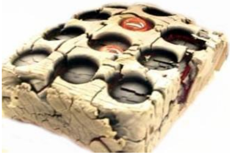
Форма для отливки монет