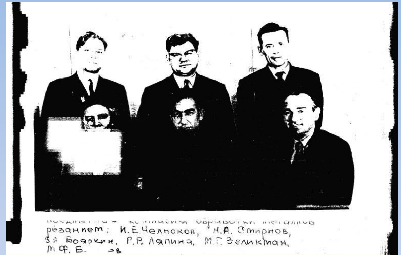
Цикловая комиссия обработки металлов

По свидетельству современников, они зарекомендовали себя высококвалифицированными специалистами.