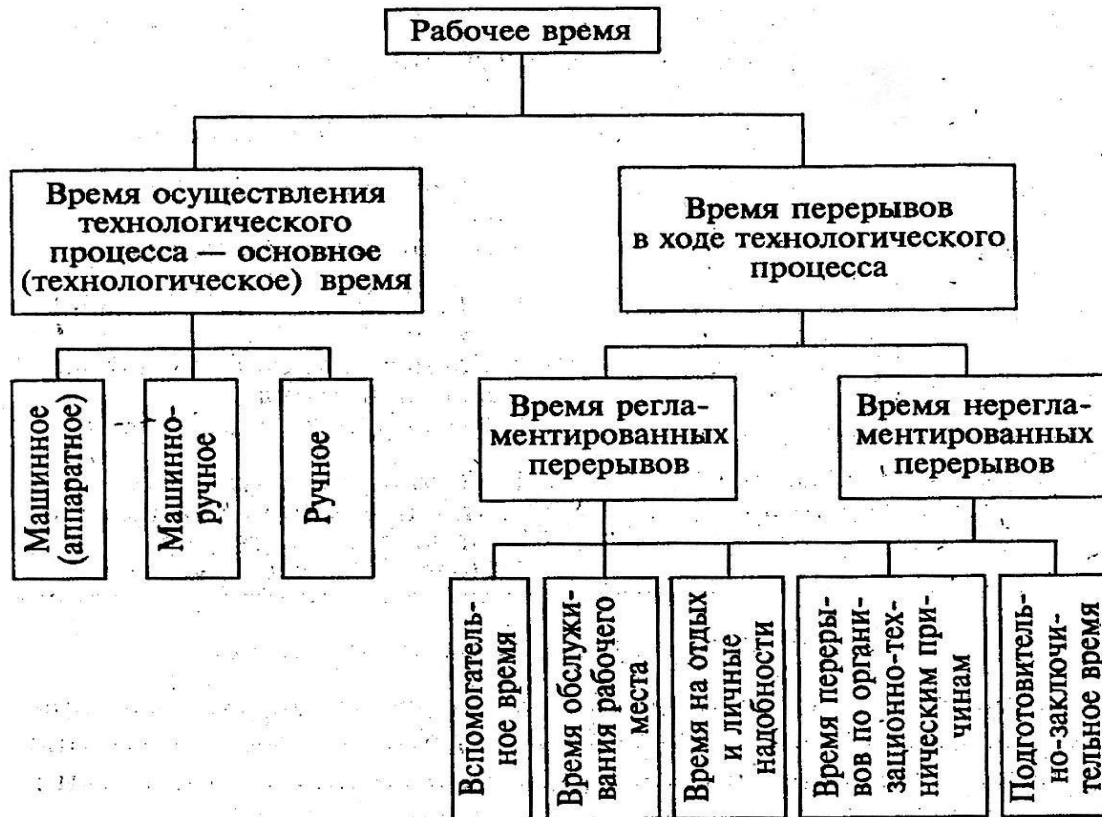
Рис. 2.6.1. Схема классификации затрат рабочего времени по отношению к предмету труда