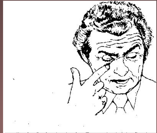
Рис. 53. Потирание века пальцем.

Если собеседник прикрывает рукой рот, большой палец прижат к щеке – это один из наиболее явных признаков лжи. Менее заметный признак – почесывание или поглаживание своего носа. О лжи может свидетельствовать и потирание века.