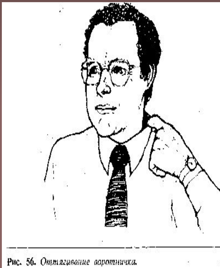
Рис. 56. Оттягивание воротничка.

Ложь способна вызывать легкие зудящие ощущения в мышцах лица и шеи. Этим и объясняется зачастую настойчивое желание лжеца почесать нос, оттянуть воротничок рубашки или ослабить галстук.