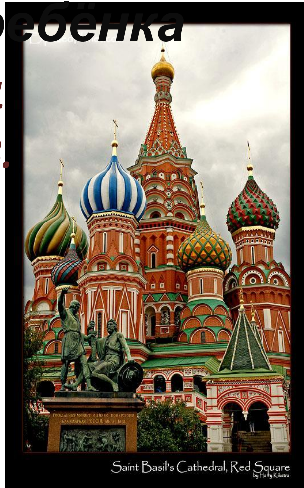
Saint Basil's Cathedral, Red Square by Flaky Katsra