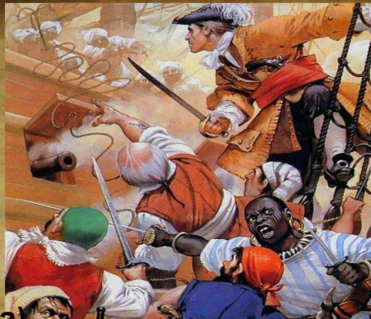
Эдвард Тич (Черная Борода)