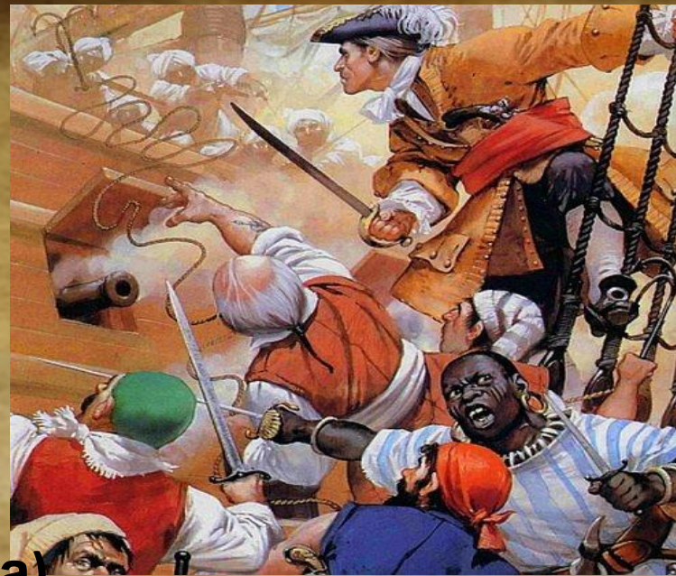
Эдвард Тич (Черная Борода)