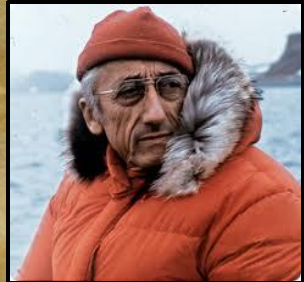
Жак Ив Кусто