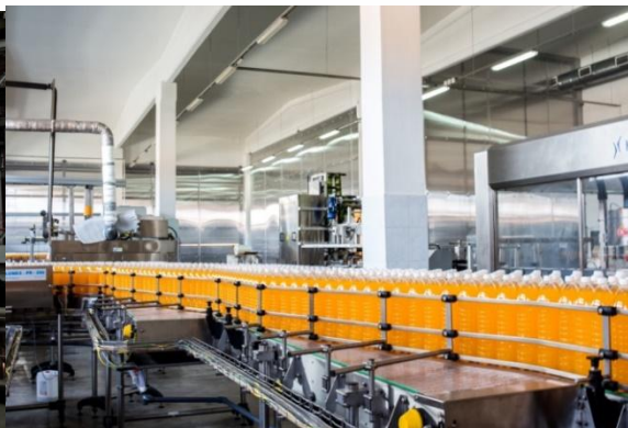
Водная компания «Ниагара»