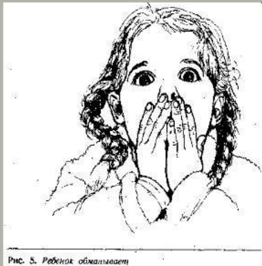
Рис. 5. Ребенок обманывает