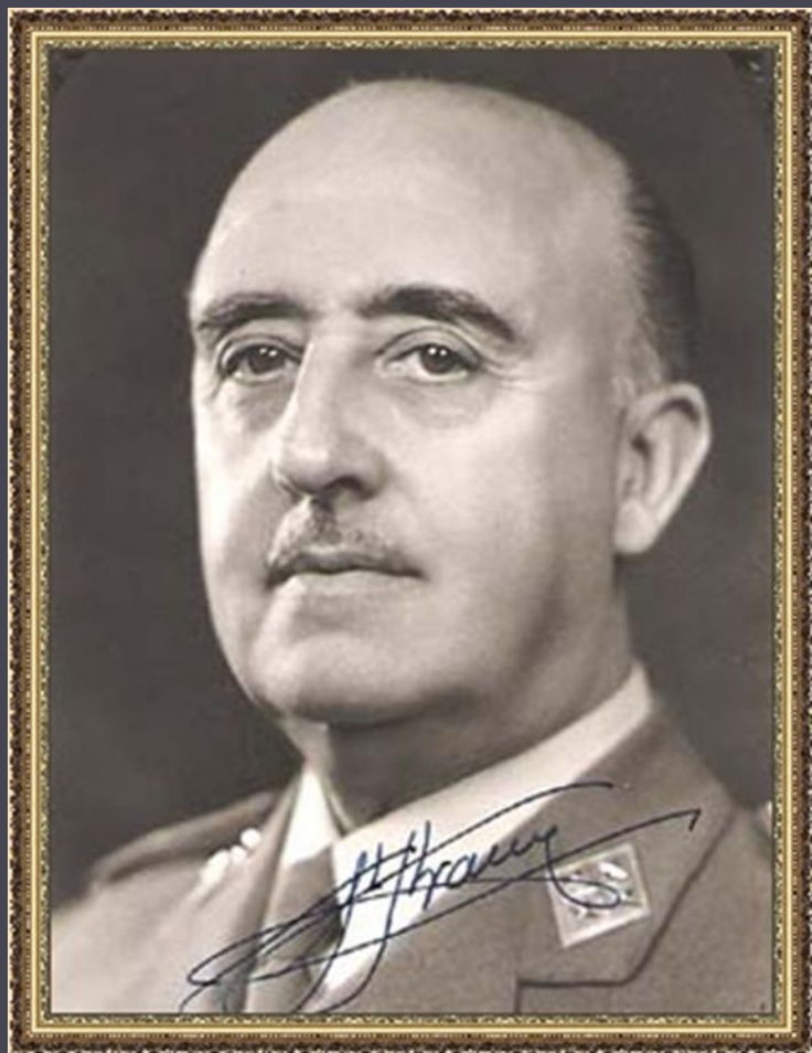
Генерал Ф. Франко