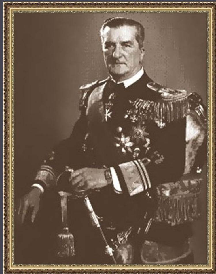
Адмірал М. Хорті.