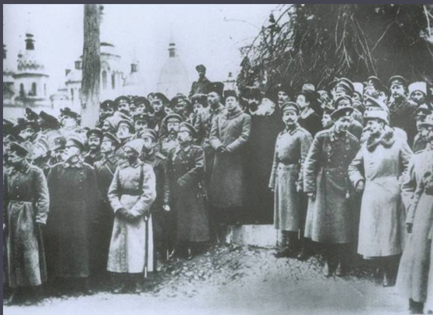
Проголошення ІІІ-го Універсалу. Київ, листопад 1917 р.