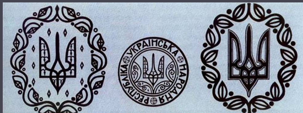
Герб і печатка УНР