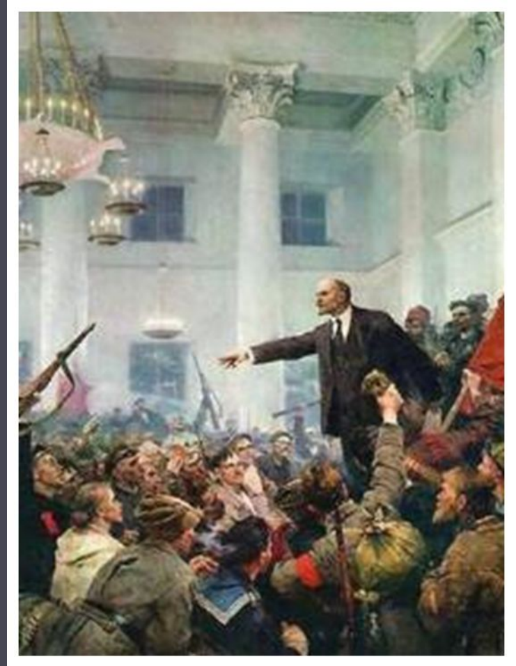
С.Серов. Ленин проголошує Радянську владу.