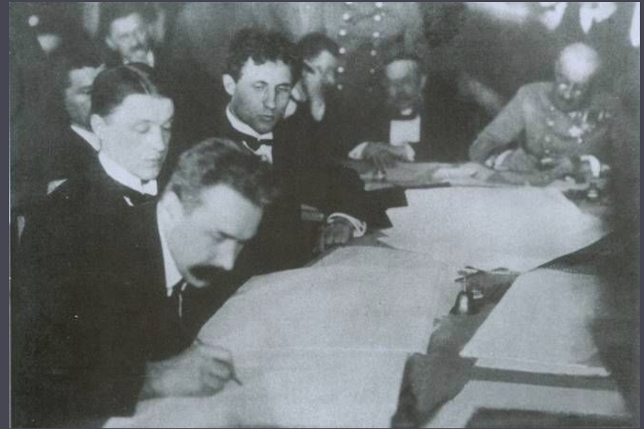
Підписання Берестейського миру. 1918 р.