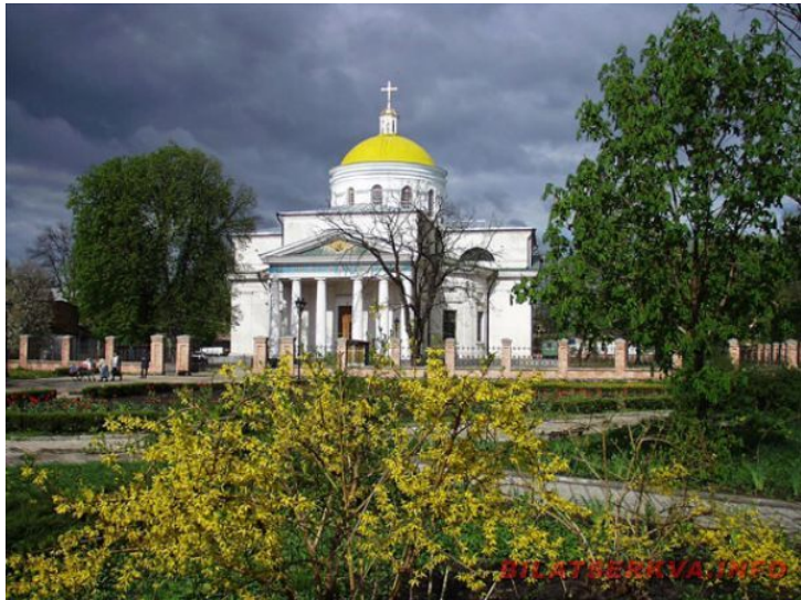
Преображенський собор в Б.Церкві