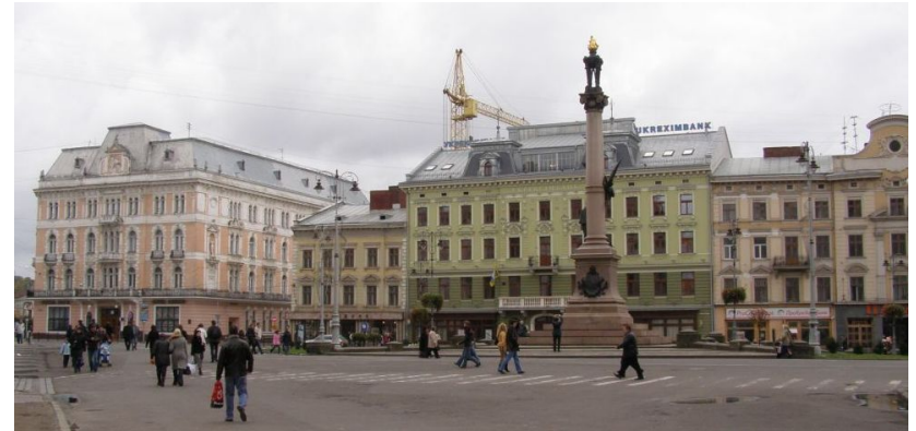
Площа Адама Міцкевича в Львові