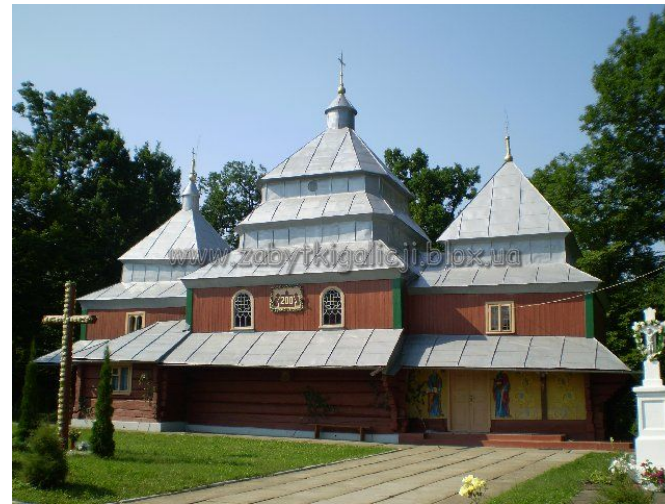
Церква Зіслання Святого Духа (с.Підгірці)