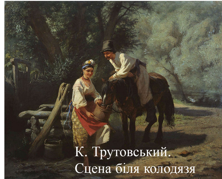
К. Трутовський. Сцена біля колодязя