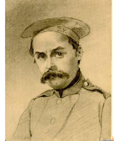
Перший автопортрет періоду заслання