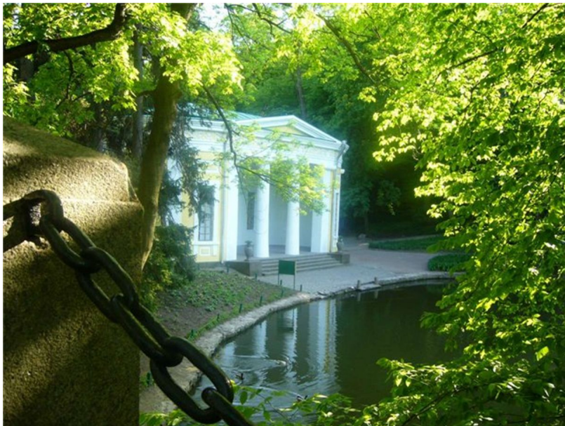
Арх. Л.Метцель. Уманський дендрологічний парк