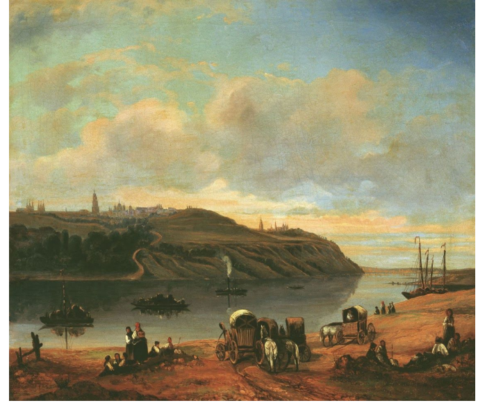
Вид на Дніпро