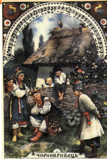
А. Ждаха. Малюнок до пісні.