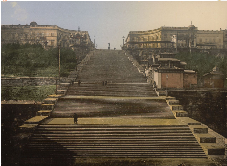
Ф.Боффо. Потьомкінські сходи