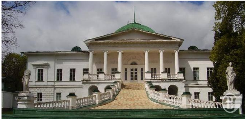
Арх. П.Дубровський. Палацово- парковий ансамбль у Сокиринцях