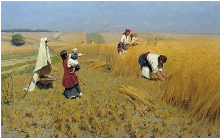
М. Пимоненко. Жнива