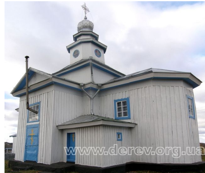
Церква преображення Господнього с.Сухоліси (Київщина)