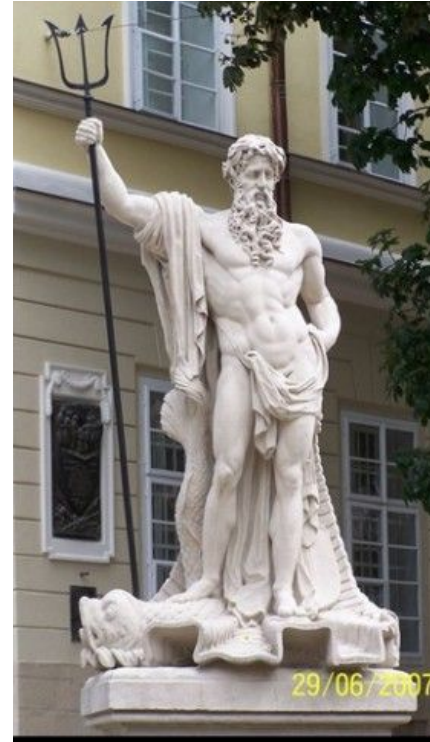
Гартман Вітвер. Скульптури в центрі Львова