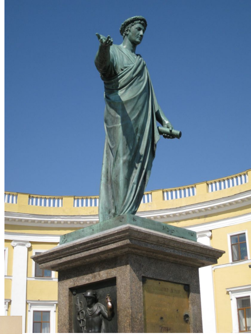
І.Мартос. Пам'ятник Дюку де Рішельє