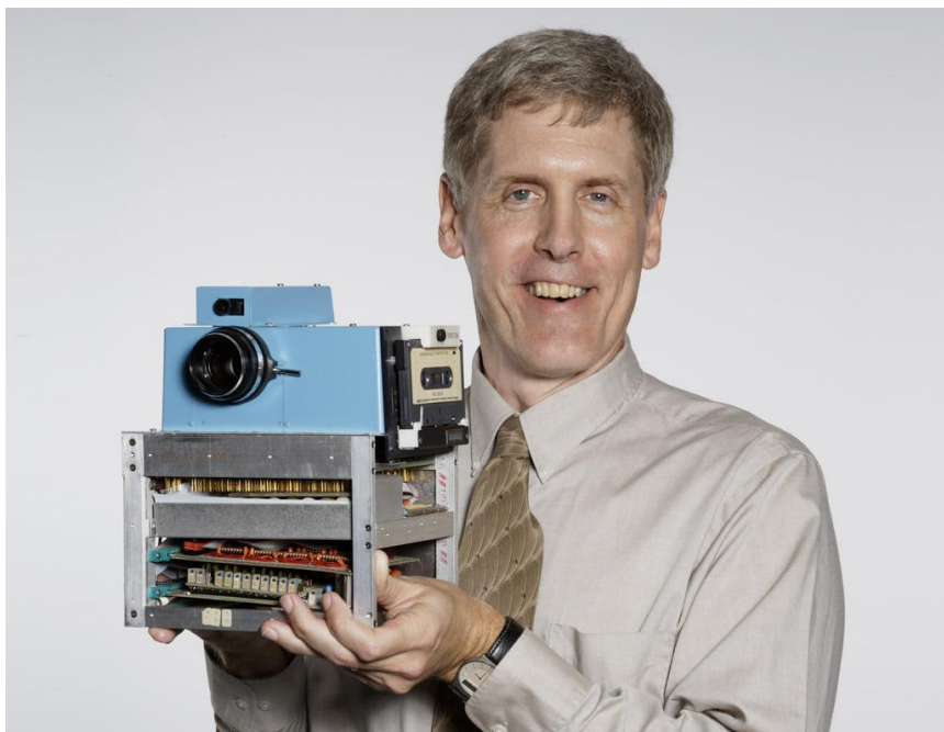
Steven Sasson и его изобретение