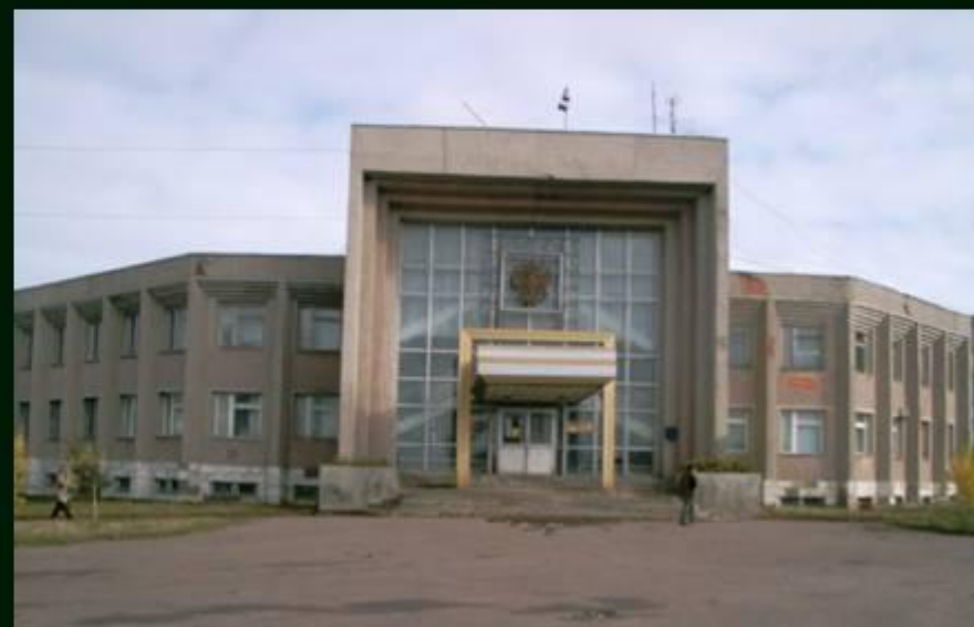
Орган местного самоуправления