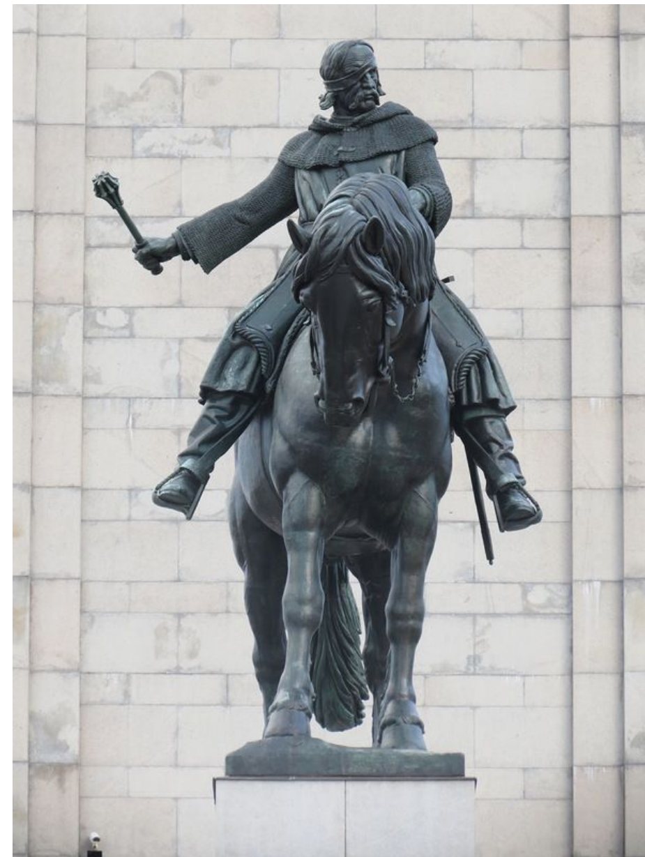
Памятник Яну Жижке, г. Прага, Чехия, 1933 г.