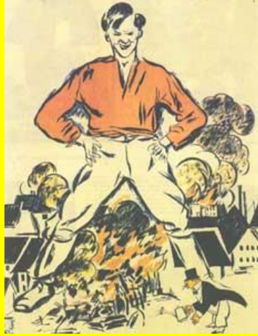
АГИТПЛАКАТ, 1917 г.