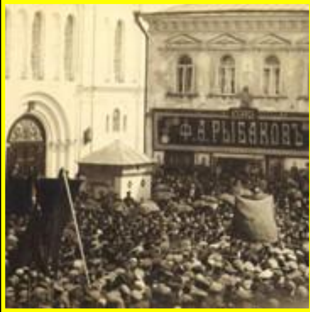
МИТИНГ В ИВАНОВО – ВОЗНЕСЕНСКЕ 1917 год

«В царстве красных флагов, радостного крика, Торжества, что пало зло родной страны..»