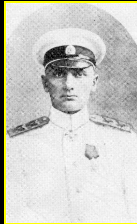
Адмирал А.В. Колчак