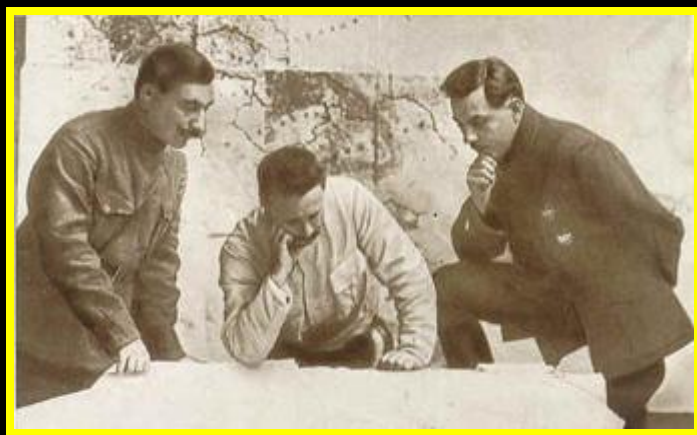
С. М. Буденный, М. В. Фрунзе и К. Е. Ворошилов обсуждают план разгрома Врангеля. 1920 г.