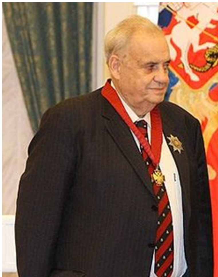
Рязанов после награждения орденом «За заслуги перед Отечеством» II степени, 2008 год