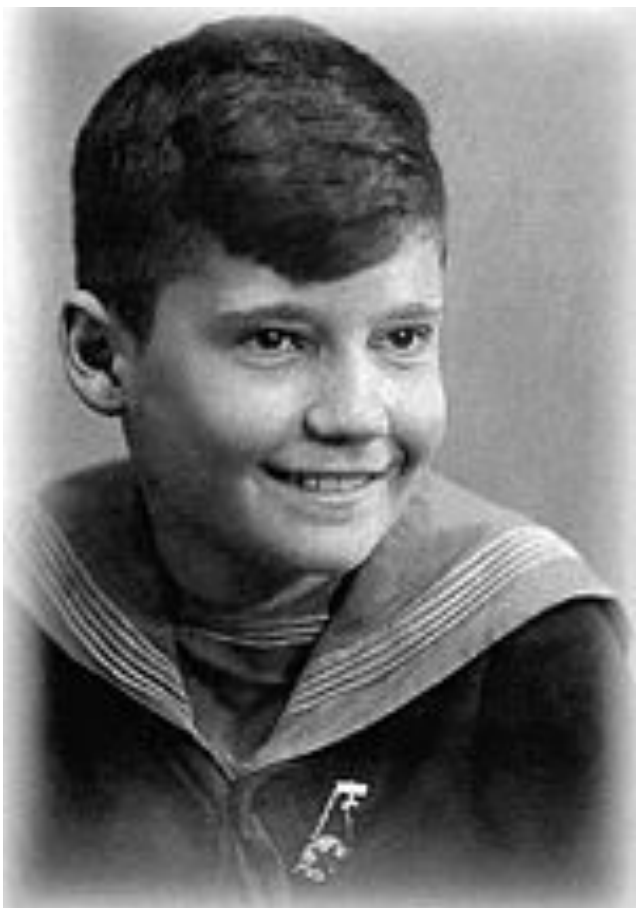
Эльдар Рязанов, 1941 год