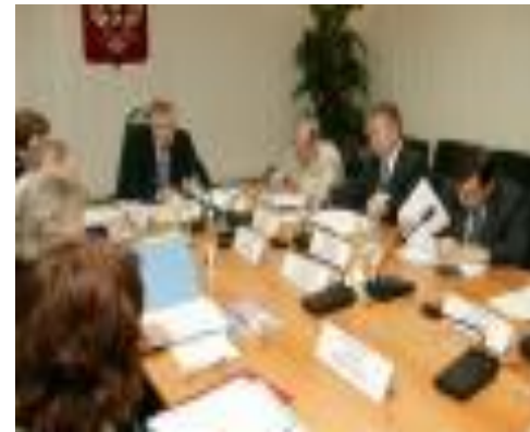
Официальная сфера, законодательство