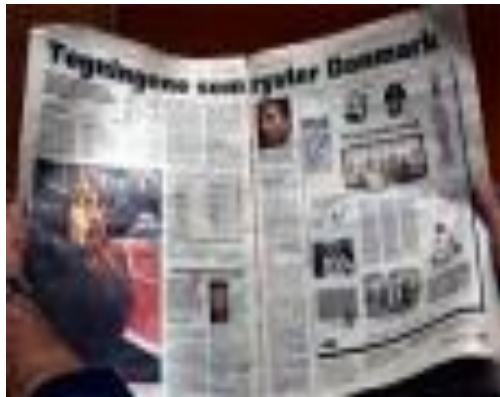
Средства массовой информации