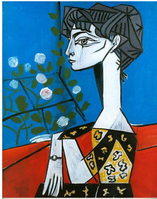
Пабло Пикассо. Портрет Жаклин Рок 1955-1964 г.г

искусство не стремится к объективности; лишь пропустив окружающий мир через призму своих чувств, человек может претендовать на звание творца.