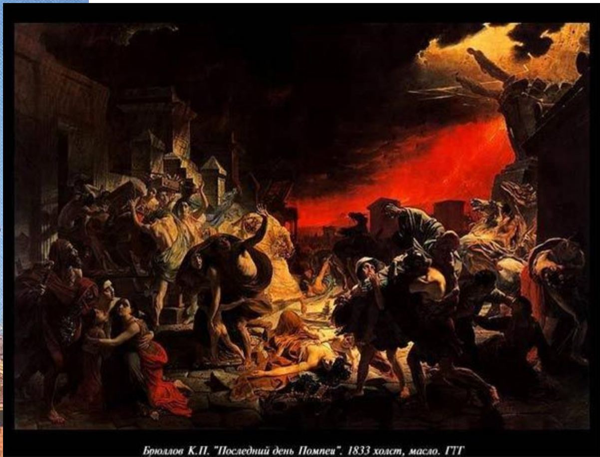
Брюллов К.П. "Последний день Помпеи". 1833 холст, масло. ГТГ