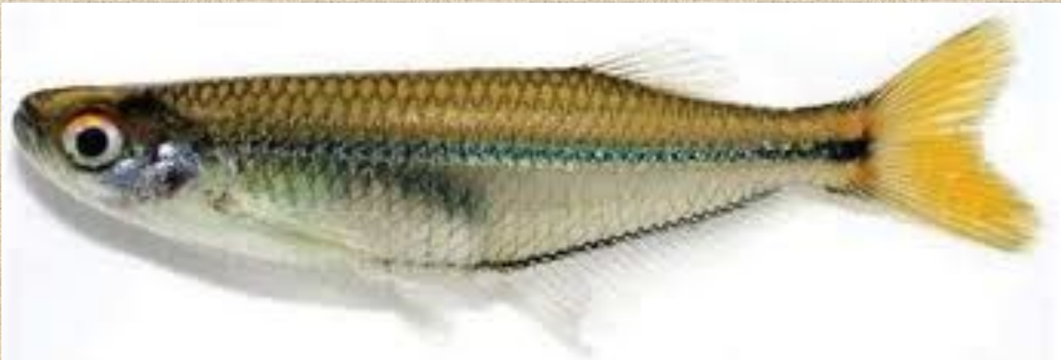
FIGURE 1. Freshly-preserved specimen of Denticipta alpeoides (SALAB 74877; same collection as MZUSP 84776), 42.1 mm SL.

Семейство Дентицепсовые - Denticipitidae – монотипичное. Это маленькая (15 см) рыбка, которая встречается в реках Бенина, Нигерии и Камеруна, известна необычным строением плавников.