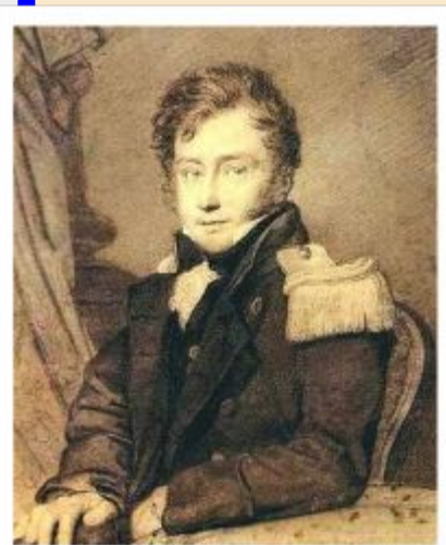
Генера л Гурко