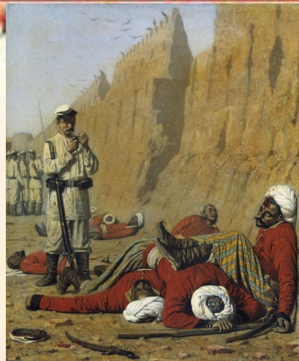
В.Верещагин. . После неудачи

Определите причины военных успехов и дипломатических неудач России в период русско- турецкой войны 1877-1878 гг.?