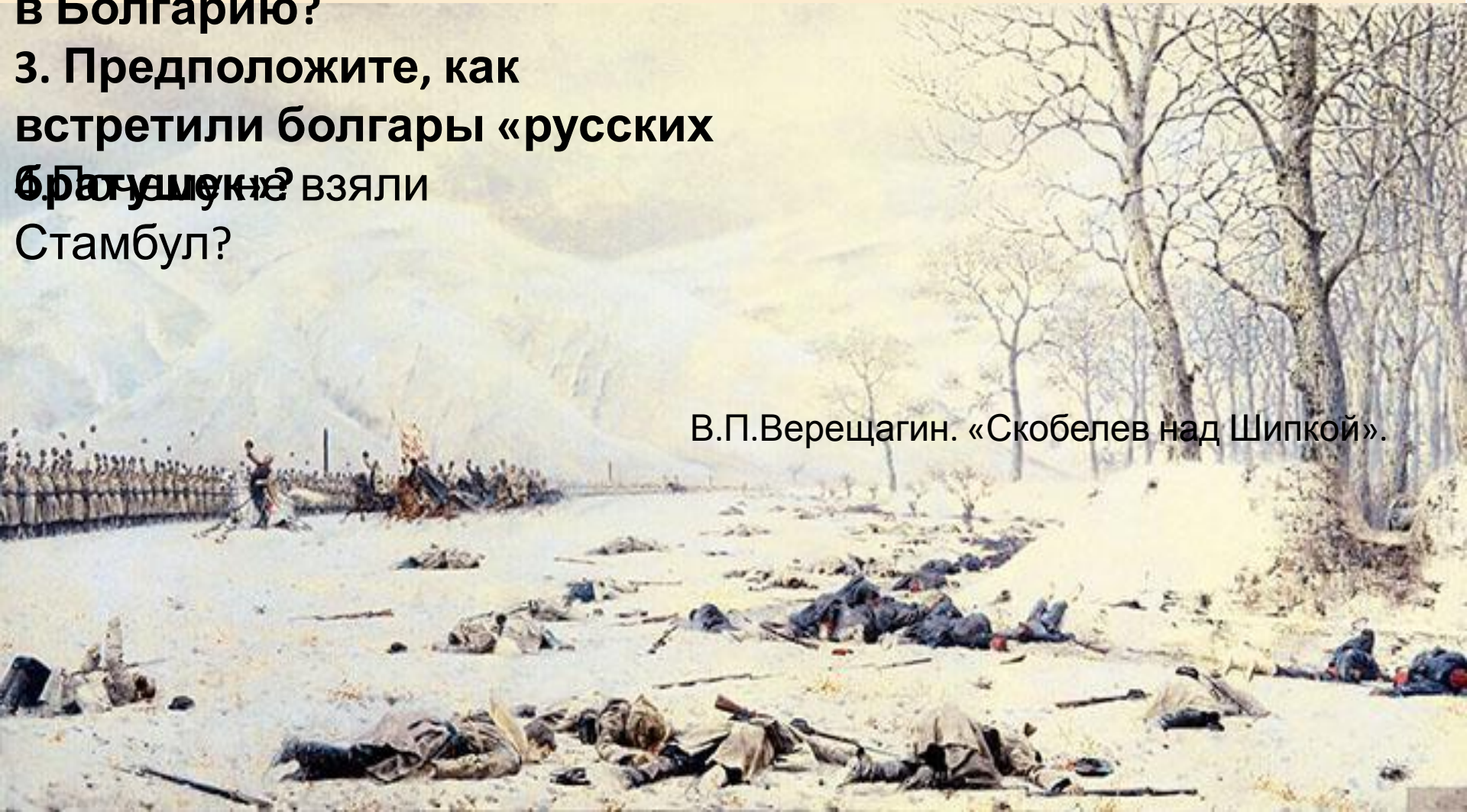
В.П.Верещагин. «Скобелев над Шипкой».