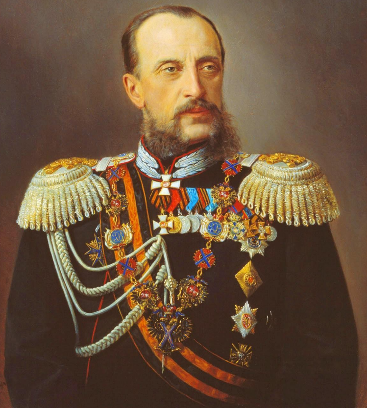
Николай Николаевич. Главнокомандующи й русской армии.

Соотношение сил складывалось в пользу России, но военная реформа не была завершена и армия испытывала недостаток в новейшем вооружении и высших командирских кадрах.