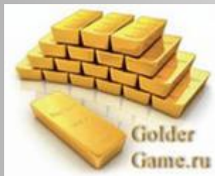
Драгоценные металлы и сырье