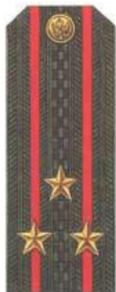
Полковник (повседневная форма одежды)