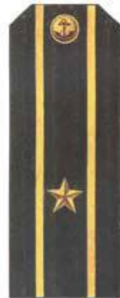
Капитан 3 ранга (повседневная форма одежды)