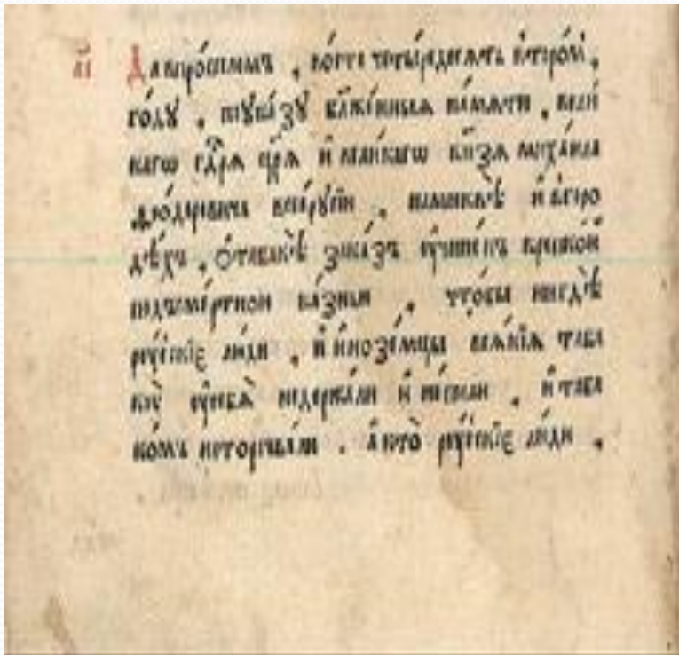
Соборное Уложение 1649 года, Фрагмент о табаке.