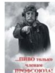
ПРОФСОЮЗ СТУДЕНТ ...