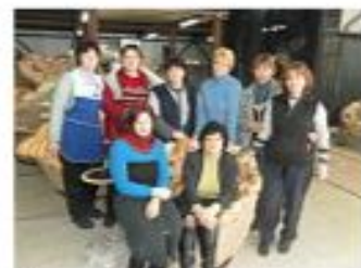
Члены проф союза ...