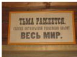
Профсоюз медрабо ...