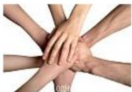
Профсоюз астраха ...