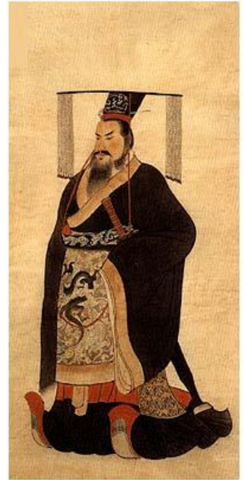
Император Цинь Ши-хуанди