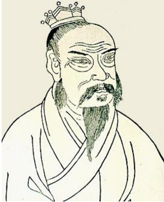
Лю Бан, первый император династии Хань