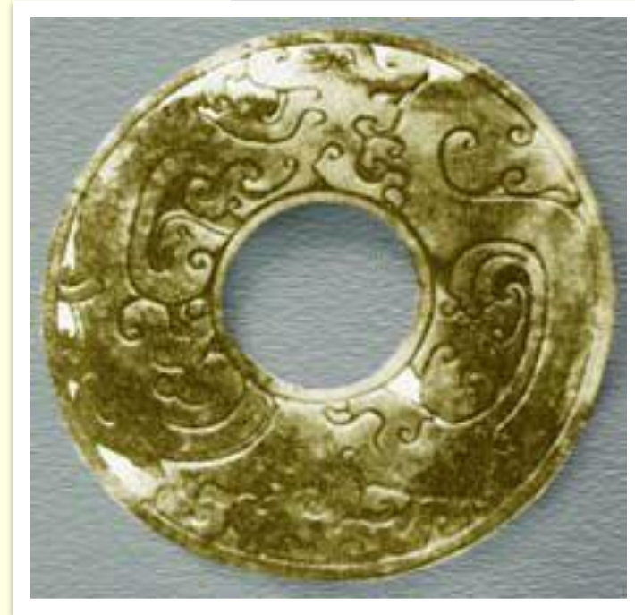
Символ неба (V век до н.э.)