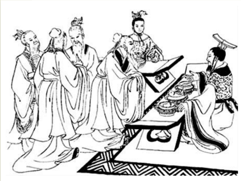
Чиновники и мудрый правитель