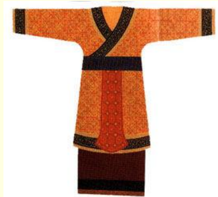
Образец одежды эпохи Чжоу