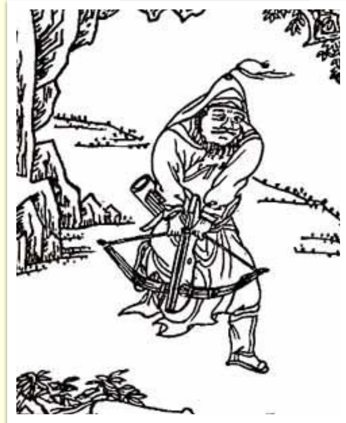
Воин эпохи династии Хань