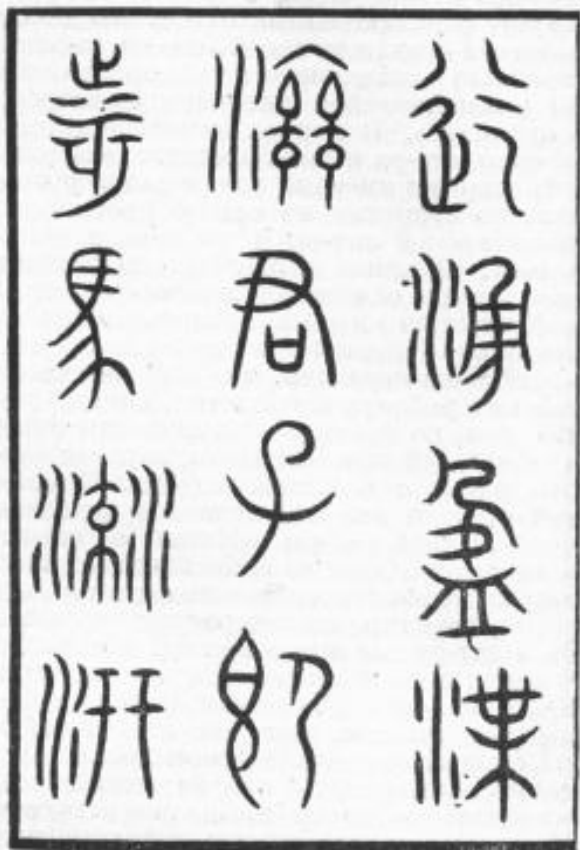
Образец письменности эпохи Чжоу