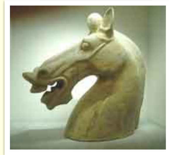
Статуэтка времен Ханьской империи