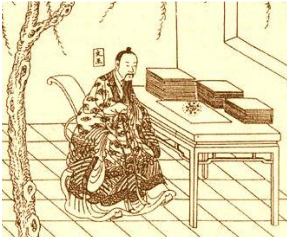
Вэнь-ван, Просвещенный правитель (1148—1051 до н.э.)