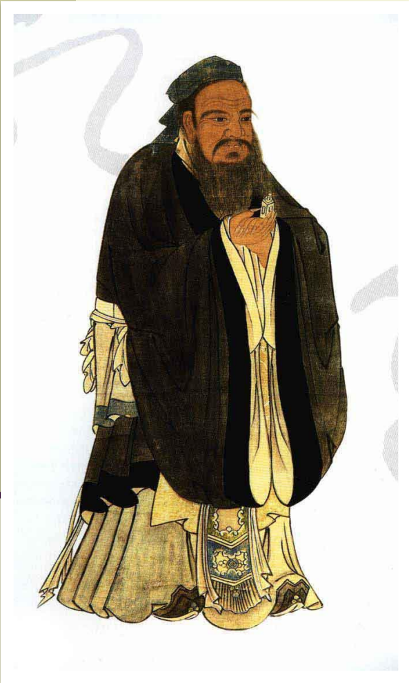
Конфуций или Кун-цзы