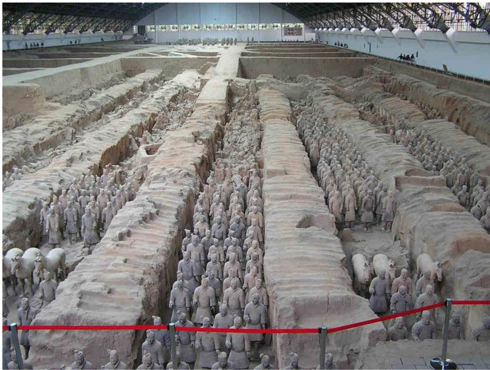
Терракотовая армия императора Цинь Ши-хуанди