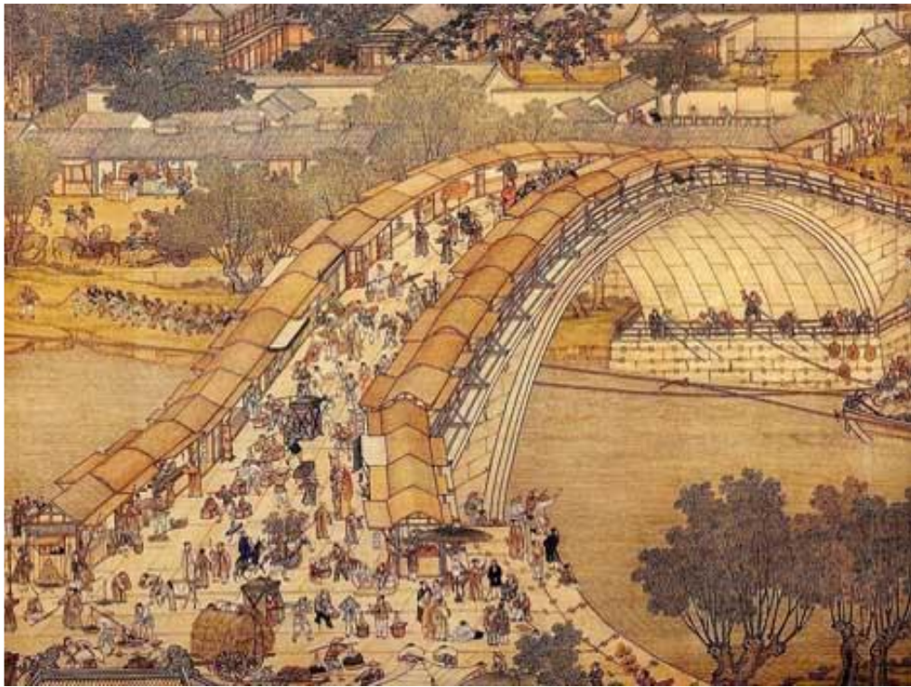
Повседневная жизнь в Древнем Китае