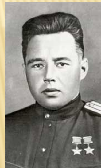
Семён Васильевич Хохряков