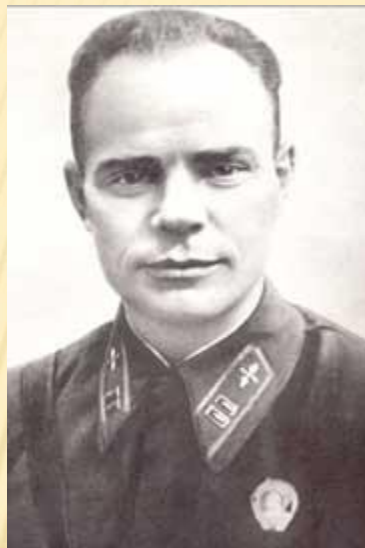
Сергей Иванович Грицевец