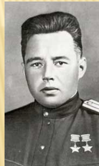
Семён Васильевич Хохряков