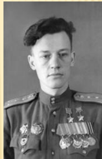
Павлов Иван Фомич