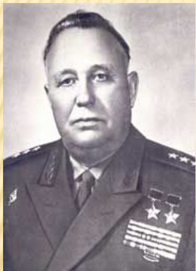
Василий Сергеевич Архипов